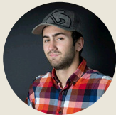
Lucas Durocher Logistique