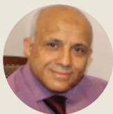
Aboubikr Sahli Formations